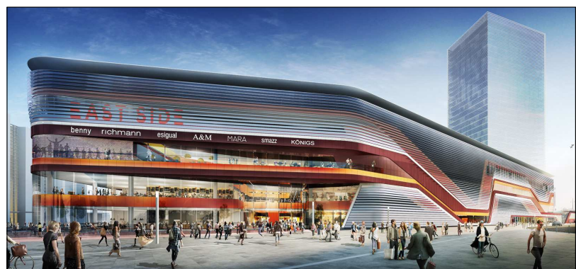
East Side Mall; Forum S.á.r.l.